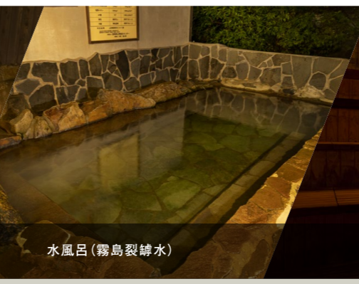
水風呂(霧島裂罅水)