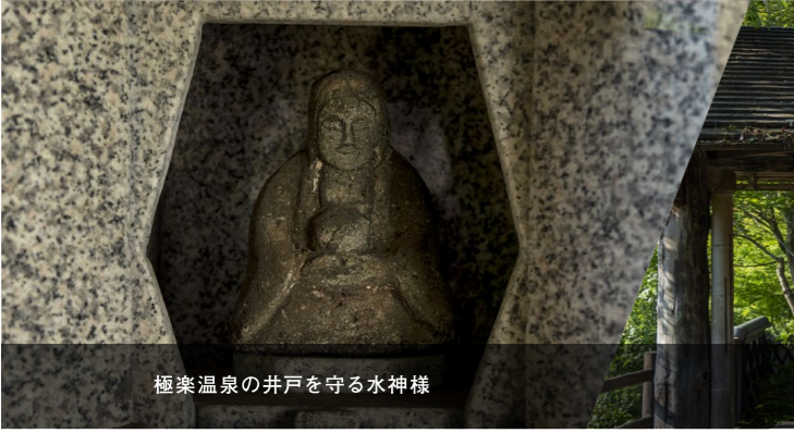
極楽温泉の井戸を守る水神様