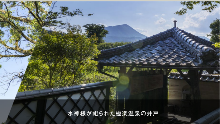
水神様が祀られた極楽温泉の井戸