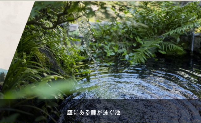
庭にある鯉が泳ぐ池