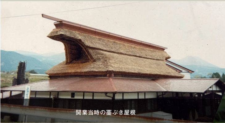
開業当時の藁ぶき屋根