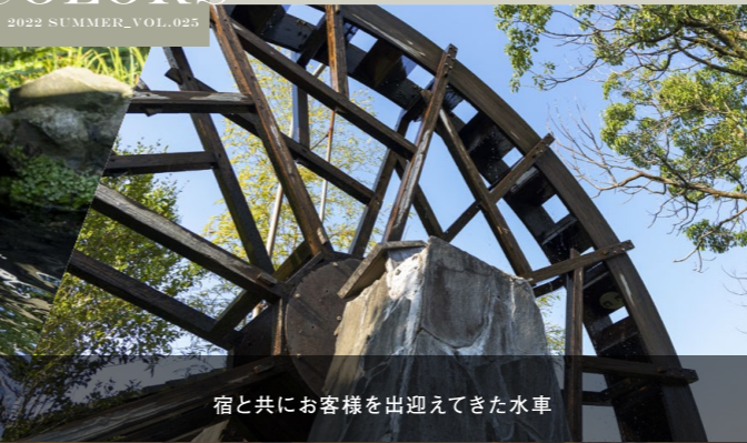
宿と共にお客様を出迎えてきた水車