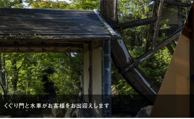
くぐり門と水車がお客様をお出迎えます