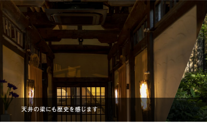
天井の梁にも歴史を感じます