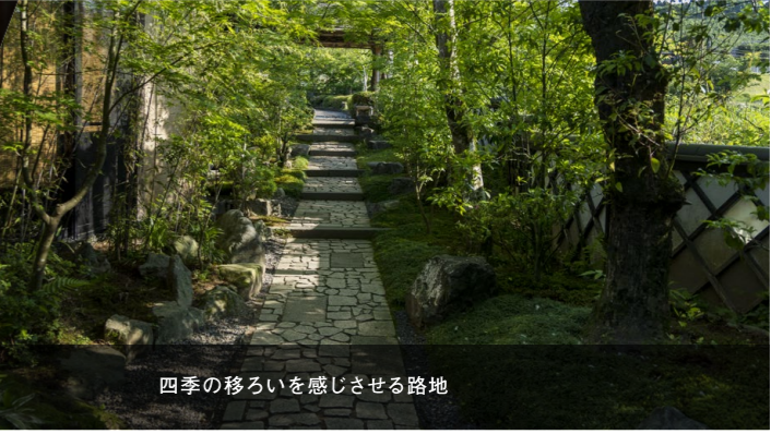
四季の移ろいを感じさせる路地