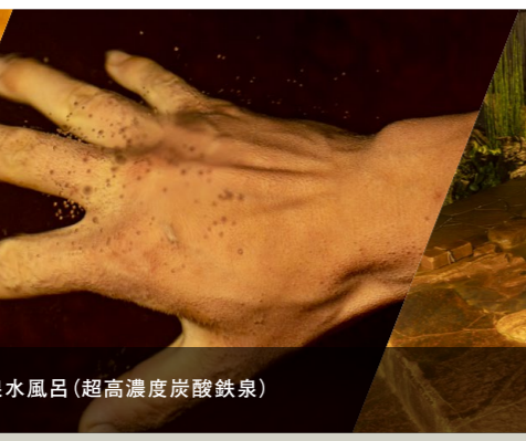
源泉水風呂(超高濃度炭酸鉄泉)