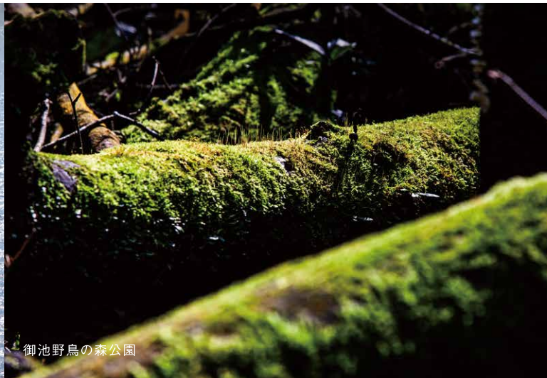
御池野鳥の森公園