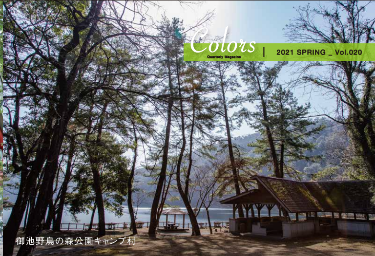
御池野鳥の森公園キャンプ村