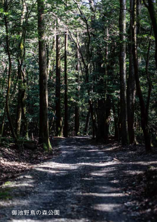
御池野鳥の森公園