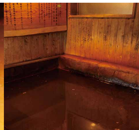
水風呂の入浴法がわかるよう看板を設置しました。