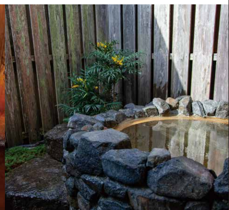
貸切風呂内に水風呂を新設しました。