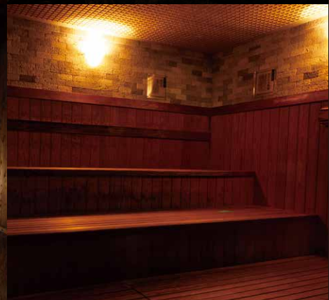
サウナ内に効能がわかるパネルを設置しました。