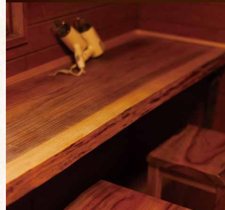
【女湯】にドライヤーをご利用いただける席を増設しました。