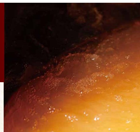
炭酸鉄泉を心ゆくまでお楽しみください。