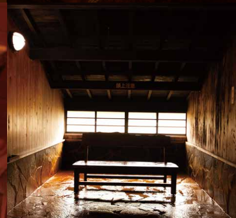
【男湯】リラックスいただける椅子を設置。