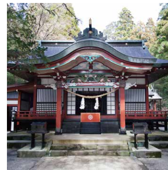
◎霧島東神社 御池側の高台にある神社。ニニギノミコト降臨の際に初めて祖先の神々を祀った所と伝えられ、高千穂峰の「天の逆鉾」はご神宝として崇められています。