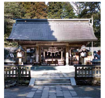
◎狭野神社 神武天皇生誕地と伝わる場所。「狭野」の名は神武天皇の幼名「サノミコト」に由来するといわれ、参道のスギ並木は国の天然記念物に指定されています。