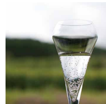
◎飲む温泉水(炭酸泉) 体内に直接取り込むことにより慢性消化器病、慢性便秘、貧血などにも効能があるといわれています。ご希望の方はボトルを持ってフロントへお尋ねください。