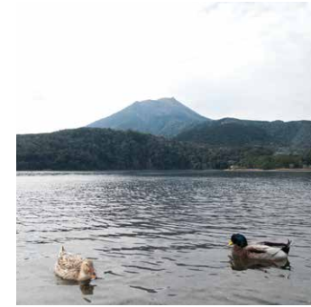
◎御池[霧島錦江湾国立公園内] 周囲4kmの霧島山系最大の火口湖です。湖の西側には全国でも4つしかない環境省指定の「野鳥の森」で野鳥の声を楽しむことができます。