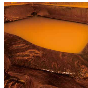
◎百選にも選ばれる名湯 極楽温泉の敷地内に自噴する温泉は「血捨ノ木川」を源流とする「炭酸鉄泉」です。昨今さまざまな効能が注目され、「婦人の湯」と大変ご好評いただいております。