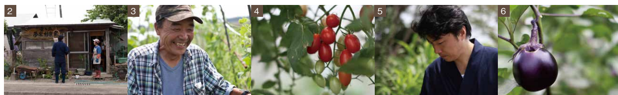
1 旬の野菜や農業についてのお話を聞かせていただきました。本当に大変な事も笑顔で話す梶並さんに脱帽です。2 道沿いにある野菜の直売所。美味しい野菜を求め様々な方が訪れます。3 作物が実る楽しさを嬉しそうに聞かせてくださる梶並さん。4 ハウス栽培を行っているミニトマト。甘さに感動です！5 真剣な眼差しで食材を見つめる極楽温泉 店主。6 ハウス栽培の加茂茄子。肉質はしっかりと甘みが強く、田楽等に最適です。

この言葉は、当宿が野菜を使わせていただいている「生駒高原農園」の梶並達明さんの言葉です。岡山県出身の梶並さんが小林に根をおろして21年。水や肥料にとことんこだわり、とことん楽しむその姿に共感する料理人が1人、また1人と増え、今では美味しい野菜や色鮮やかでユニークな野菜を全国各地へ送り出しています。（農園まで数10分の距離で、手摘みできる私たちは本当に幸せものです）『自分たちが食べたいと思うものを作り、自分が楽しいと感じなきゃ面白くない。笑顔が笑顔を生み、作る人の元気が食べる人を元気にするんだよ。』梶並さんは笑顔でおっしゃいます。私たちは、お客様の「美味しい笑顔」を想像しながら九州の山河で獲れた旬の食材を厳選し“幸せの連鎖”がまだまだ続きますようにとの想いを込めて「九州山河料理」でお客様をおもてなしいたします。お客様に心身ともに元気になっていただけるよう、これからも様々な食材を求めてまいります。現在、九州山河料理会席をはじめとする会席料理は全部で8種。ぜひ季節の味を感じ、私たちの「幸せの連鎖」を感じていただければ幸いです。皆様のお越しを心よりお待ちしております。