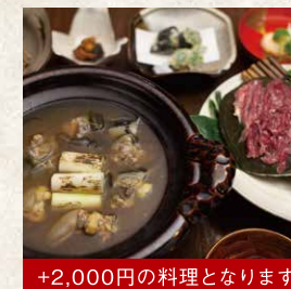
+2,000円の料理となります 九州山河料理 すっぼん会席