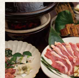
九州山河料理 霧島山麓さじ会席