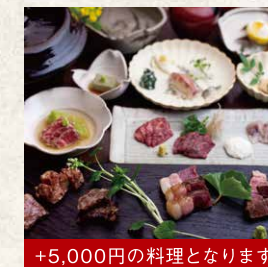
+5,000円の料理となります 九州山河料理 宮崎牛・岡崎牛会席