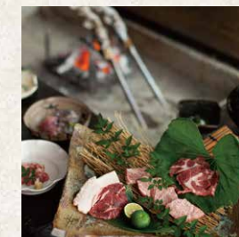
九州山河料理 囲炉裏会席