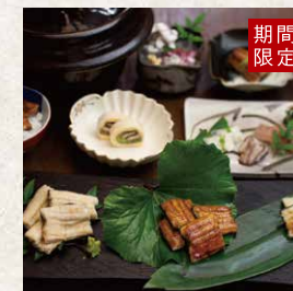
九州山河料理 大隅うなぎ会席