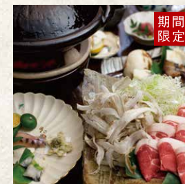
九州山河料理 嬉野鉄砲猪会席