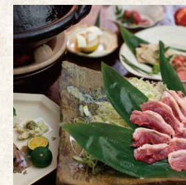
九州山河料理 薩摩かも会席