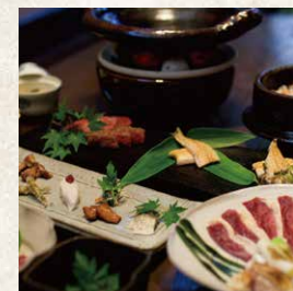
九州山河料理会席

夕食は以下の8コースからお選びいただけます。ご宿泊2日前の15時までにご予約ください。 (九州山河料理会席・九州山河料理囲炉裏会席は、前日の20時まで予約可)